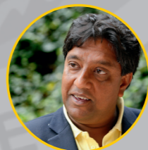
Prem Radhakishun Loterij