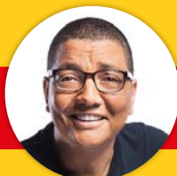
Jörgen Raymann Moderator