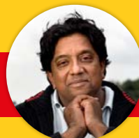
Prem Radhakishun Loterij